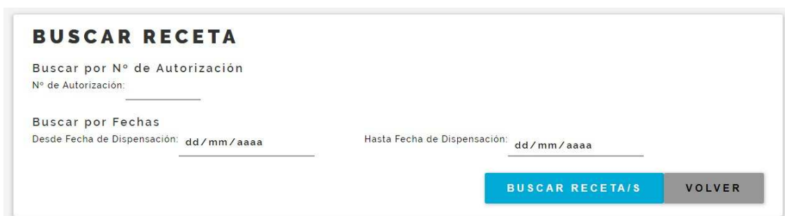
Fig. 10 Búsqueda de Recetas, paso 1