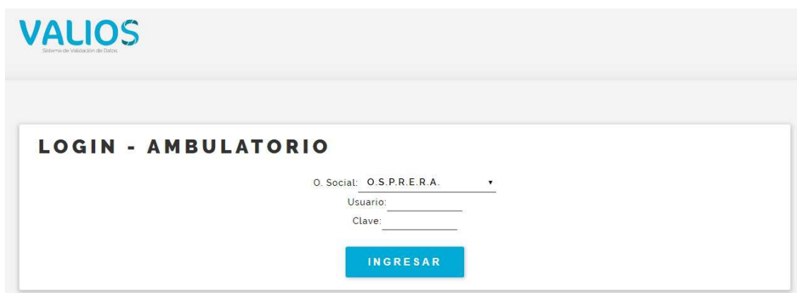
Fig. 2 Login de Ingreso