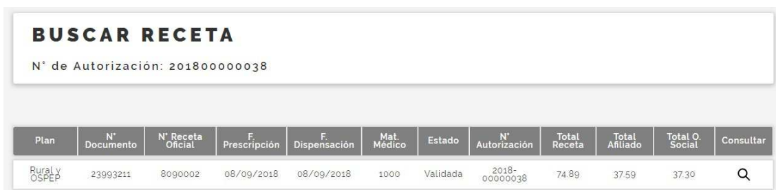
Fig. 11 Búsqueda de Recetas, paso 2