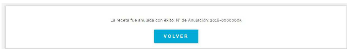
Fig. 9 Anulación de Receta, confirmación