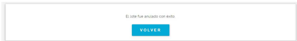
Fig. 10 Anulación de Lote, confirmación

10) Todos los lotes, ya sea que estén cerrados, anulados o presentados, se pueden consultar desde la opción “Buscar Lote” del menú de lotes (Fig. 3). Al ingresar a la misma se mostrará la siguiente pantalla, en la que se puede especificar el número de lote o el rango de fechas a consultar.