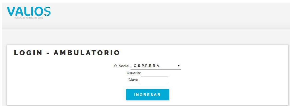
Fig. 2 Login de Ingreso