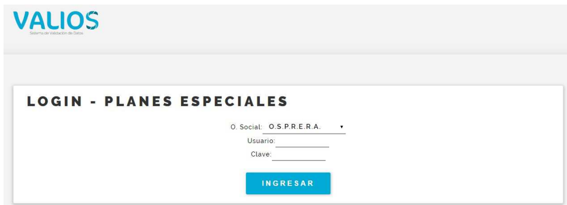
Fig. 2 Login de Ingreso