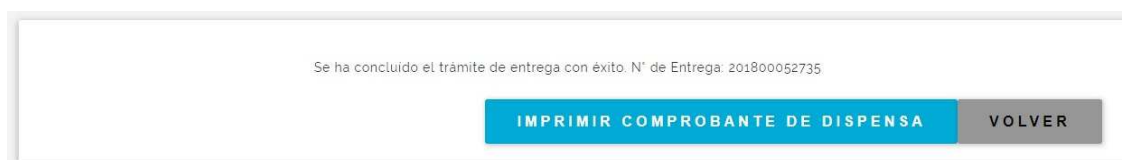
Fig. 10 Farmacia Entrega, confirmación