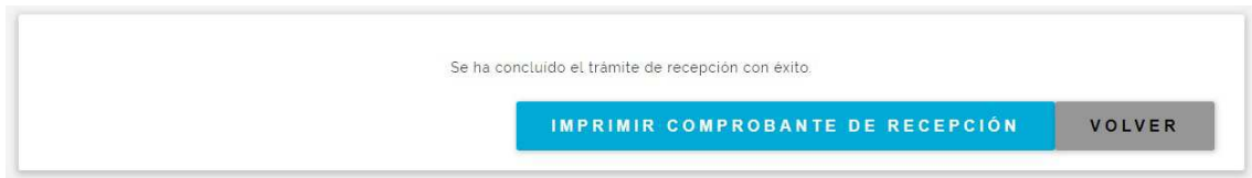
Fig. 7 Farmacia Recepción, confirmación