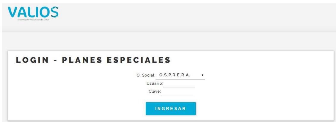
Fig. 2 Login de Ingreso